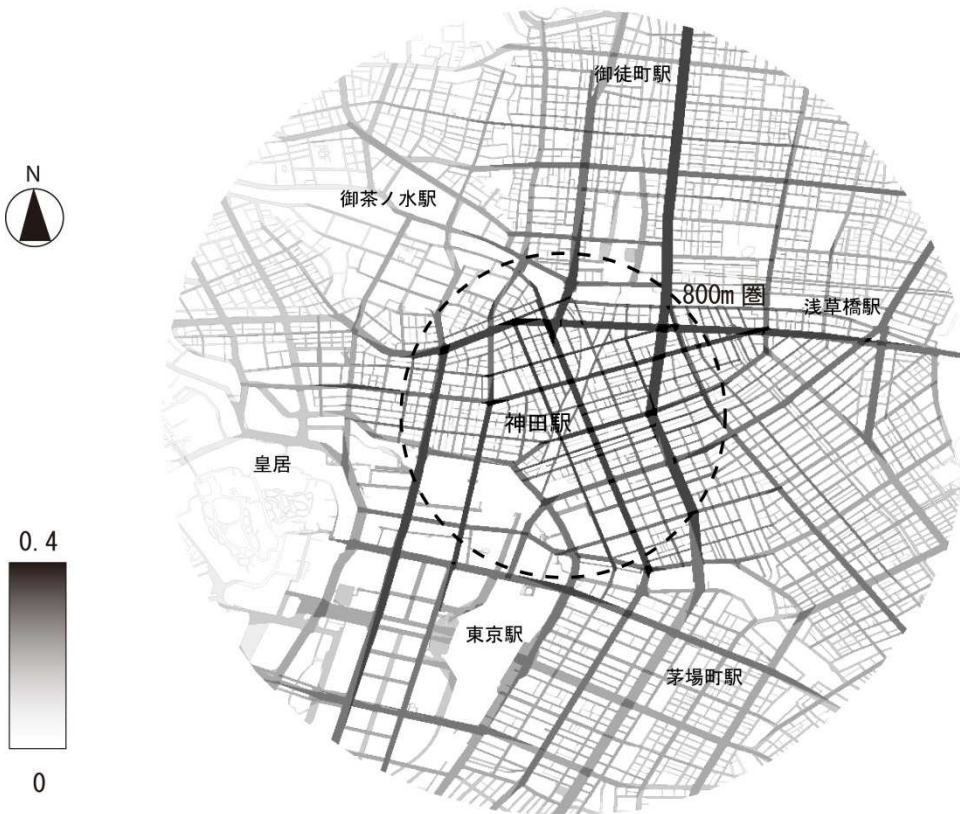
図2 神田駅 2km 圏における統合値の空間分布図